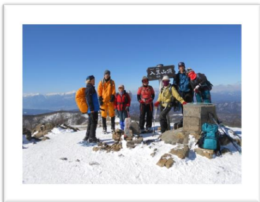
入笠山山頂に立つ