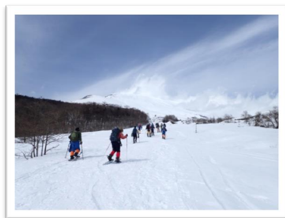
昨年度 富士山太郎坊でのスノーシューハイク