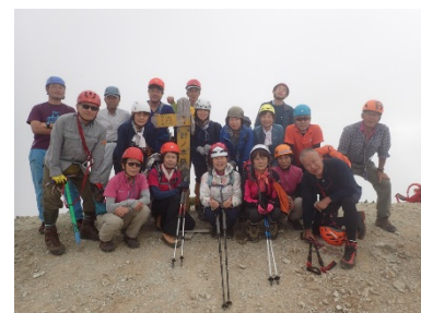
去年は針ノ木岳でした

全くの初心者でも大丈夫。県岳連所属山岳会のベテランがご案内します。あなたも登ってみませんか。甲斐駒ガ岳・仙丈岳へ。