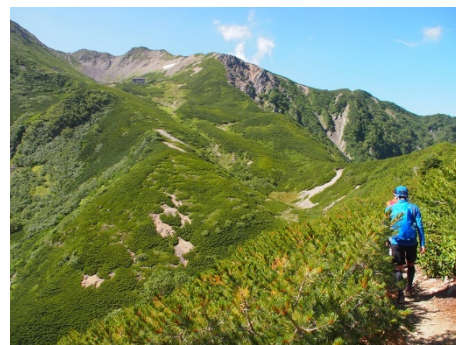
仙丈岳はカールが有名です。