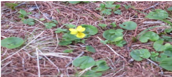
キスミレ 青薙山 2017.6