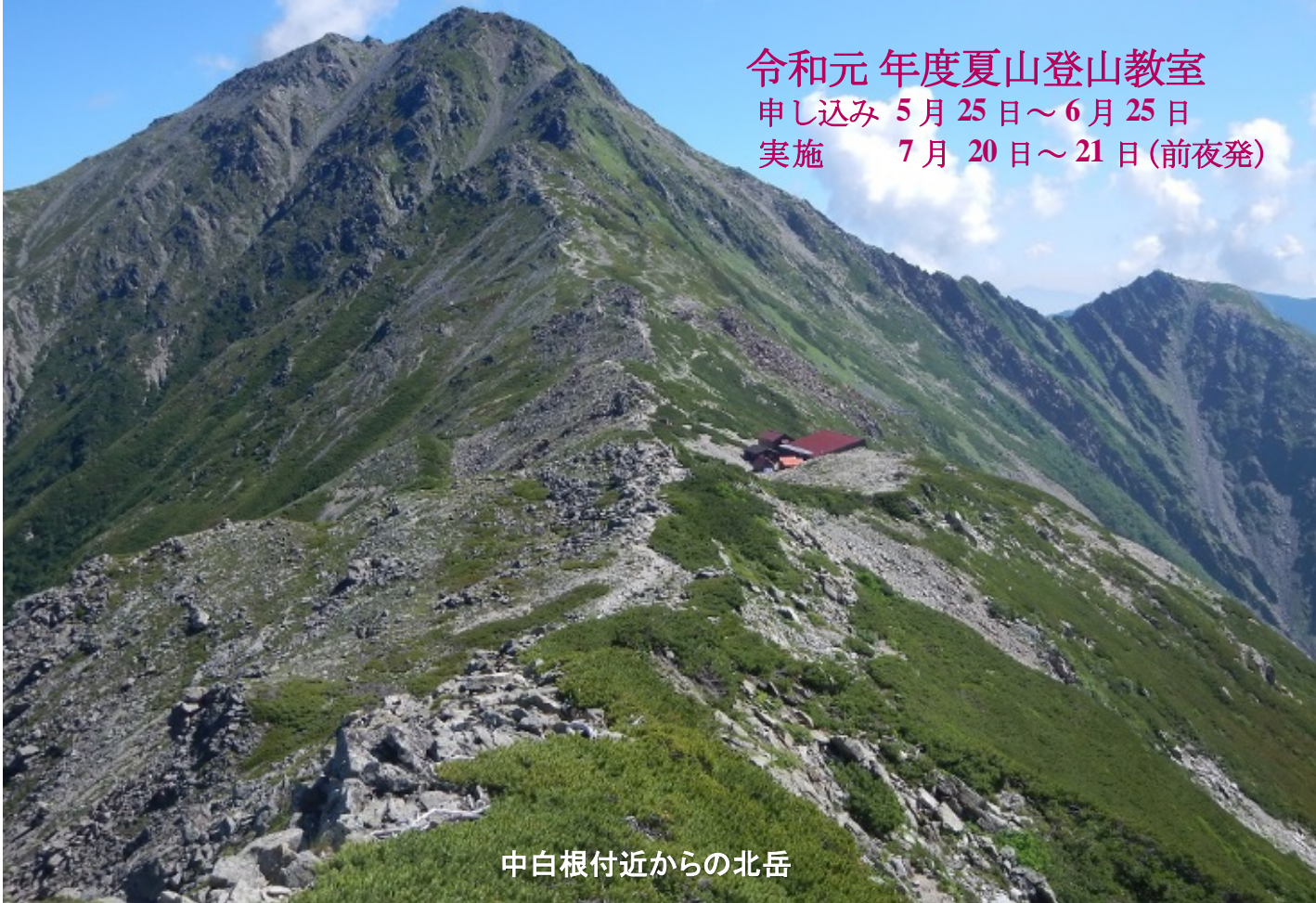
中白根付近からの北岳

令和元年度夏山登山教室 申し込み 5月25日～6月25日 実施 7月20日～21日(前夜発)