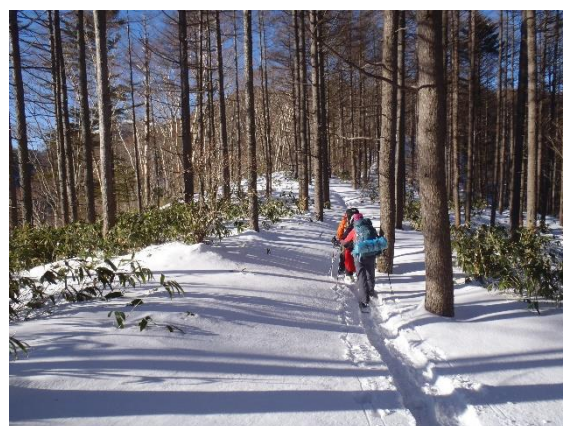
【カラマツの林を進む】

静岡県山岳・スポーツクライミング連盟が初心者を対象に雪山登山教室を開催致します。正しい雪山知識を身につけスノーハイクを楽しみましょう。県岳連所属山岳会の公認山岳コーチ(指導員)が雪山の楽しみ方と安全知識を指導致します。