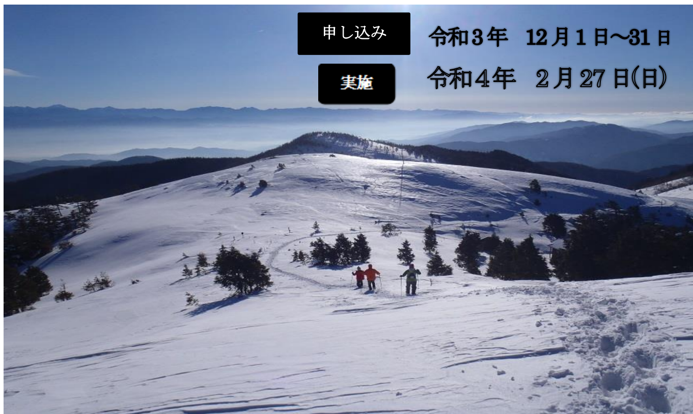
【陽光を受けて富士見台を目指す】

静岡県山岳・スポーツクライミング連盟が初心者を対象に雪山登山教室を開催致します。正しい雪山知識を身につけスノーハイクを楽しみましょう。県岳連所属山岳会の公認山岳コーチ(指導員)が雪山の楽しみ方と安全知識を指導致します。