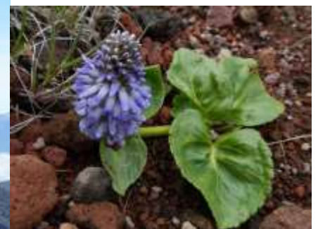
ウルップソウ (8月には見れません)