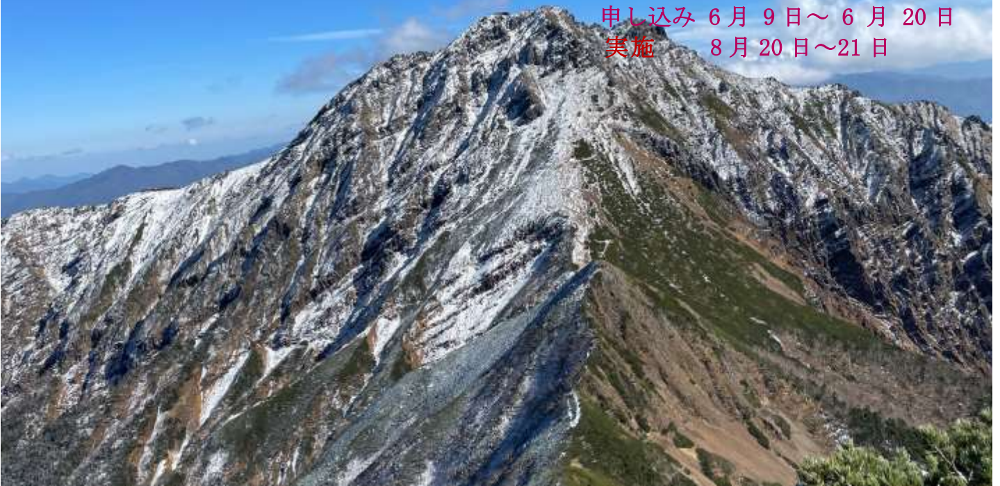
阿弥陀岳からの初冬の 赤岳

静岡県山岳スポーツライミング連盟主催の夏山登山教室、8回目の今年はハヶ岳の主峰・赤岳（2899m）に登ります。赤岳はハヶ岳連峰の最高峰。堂々とした山容は名実とも主峰にふさわしく高山植物にも恵まれています。コロナ禍のため、2年振りの開催です。新型コロナウイルス感染症対応には充分考慮して開催いたします。