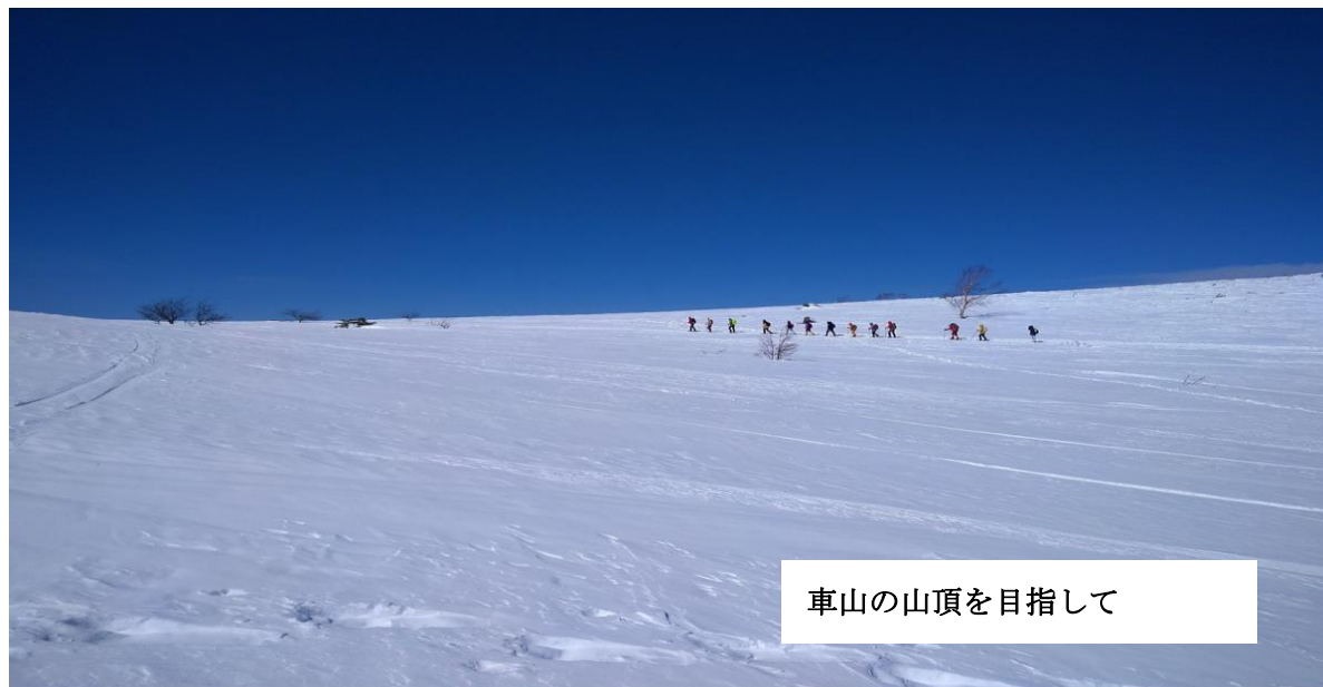
車山の山頂を目指して