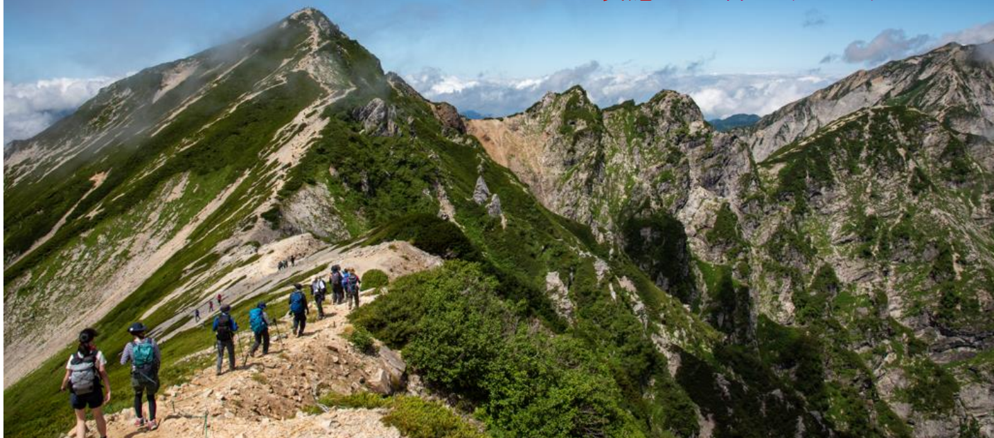
唐松岳山頂を目指して

静岡県山岳・スポーツクライミング連盟主催の夏山登山教室、10回目の今年は八方尾根から北アルプス・唐松岳（2696m）に登ります。八方尾根は唐松岳から派生した尾根で、「日本百名山」の白馬岳・鹿島槍ヶ岳・五竜岳の展望台として人気が高く、登山道は良く整備されていて危険箇所も少なく北アルプスの入門コースです。